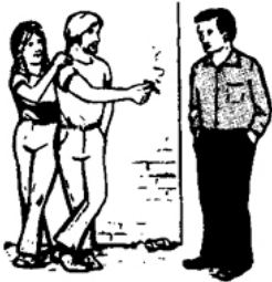
Aprende a decir “No”.

Una de las palabras más importantes que debemos aprender a decir, es la pequeña palabra de dos letras: “No”. Debemos aprender a decirla amigable, firme y definitivamente.