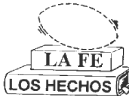
La fe se basa en los hechos de Dios.

Ahora miremos en la palabra de Dios y aprendamos más sobre la fe.