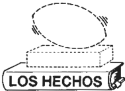
LOS HECHOS de Dios forman los cimientos.

Por ejemplo, sabemos que Jesucristo murió por nuestros pecados y resucitó para ser nuestro Salvador viviente. Sabemos que esto es cierto por que lo dice la palabra de Dios. Una persona puede creerlo o no, pero aun es verdad. Los hechos de Dios son siempre verdad.