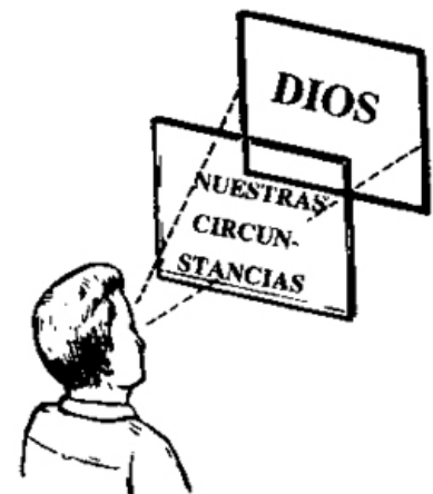
La fe mira más allá de las circunstancias y descubre a Dios obrando a nuestro favor.

En cuanto a nosotros, cuando escogemos “andar por vista”, vemos sólo las circunstancias; pero cuando escogemos “andar per fe”, vemos más allá de las circunstancias y descubrimos a Dios obrando a nuestro favor.